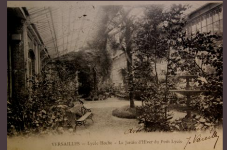
VERSAILLES — Lycée Hoche - Le Jardin d'Hiver du Petit Lycée J. Vercell

Le petit lycée est détruit au début des années 1960 pour être remplacé par un nouveau bâtiment destiné aux classes préparatoires et à la cantine.