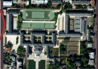
Le lycée aujourd'hui