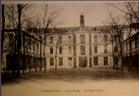
VERSAILLES — Lycée Hoche - Le Petit Lycée

En 1906, la diminution du nombre des internes conduit à transformer un dortoir du petit lycée en 6 salles d'étude. Jusqu'en 1960, il accueille les garçons de l'enseignement primaire et ceux des premières années de lycée (6 e et 5 e ). Sous la magnifique verrière de son grand jardin d'hiver poussent des palmiers. Les professeurs l'utilisent comme parloir pour recevoir les parents.