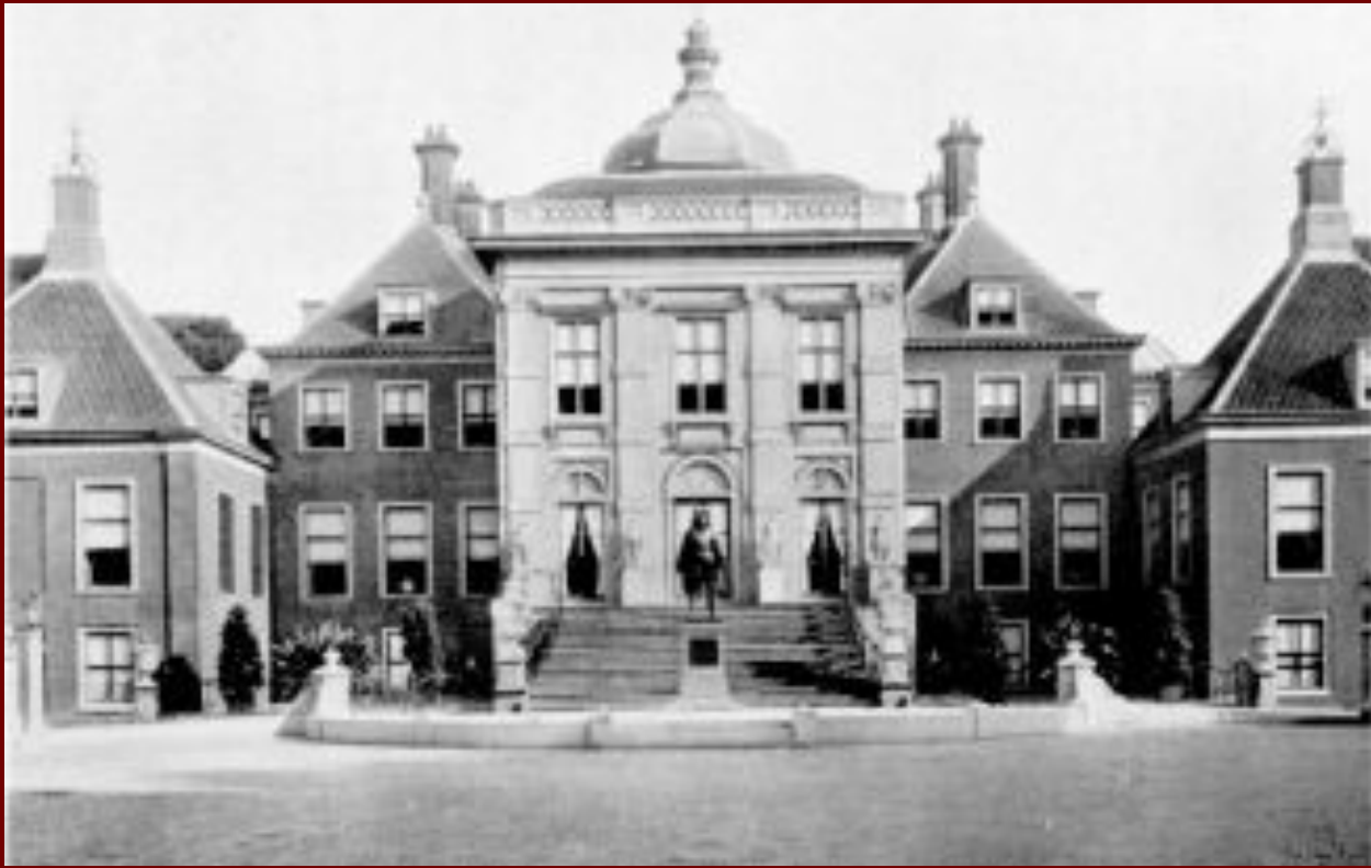
Première conférence de la Haye : Palais au Bois

En 1899, une conférence fut organisée à La Haye à l'initiative du tsar Nicolas II de Russie. Les Actes de la Haye aboutirent à une convention concernant les lois et coutumes de la guerre sur terre. Fut alors interdit « l'emploi de gaz asphyxiants ou délétères ». L'Allemagne, La France et l'Angleterre ratifièrent alors ces Actes.