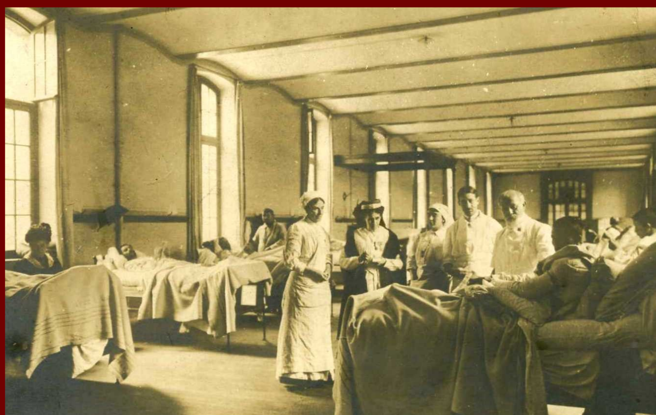
Salle de blessés dans un lycée-hôpital semblable au petit lycée Hoche