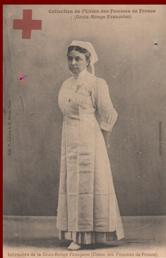
Infirmière de l'UFF